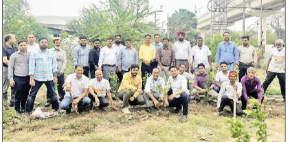
बहादुरगढ़। रतन टाटा फॉरेस्ट में पहुंचे टाटा समूह के अधिकारी व स्टाफ सदस्य।

बहादुरगढ़। पर्यावरण प्रेमियों की ओर से रोहताक-दिल्ली रोड पर विकसित किए गए रतन टाटा सिटी फॉरेस्ट में वीरवार को टाटा वेल्यू होम कंपनी के अधिकारियों और स्टाफ ने शिरकत की। अधिकारियों ने रतन टाटा के नाम पर बनाए गए इस फॉरेस्ट की खूबसूरती निहारने और खुशी जताई। इस दौरान वलीन एंड वीन ट्रस्ट के सदस्यों के साथ मिलकर परिसर में गुड़हल, अनार, अमरुद आदि के लगभग 50 पौधे लगाए। अधिकारियों ने कहा कि पर्यावरण संरक्षण की दिशा में पर्यावरण प्रेमियों ने काफी सराहनीय कार्य किया है। मविष्य में वे भी इस मुहिम से जुड़कर यहां पर्यावरण संरक्षण पर जोर देंगे।