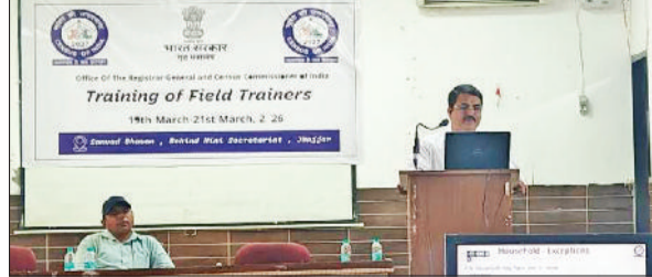
झज्जर। फील्ड ट्रेनरों को प्रशिक्षित करते हुए विषय विशेषज्ञ।

की नीतियां और विकास योजनाएं तय होती हैं। जनगणना 2027 के प्रथम चरण के तहत मकान जा रहे। उन्होंने कहा कि फील्ड ट्रेनर की भूमिका बेहद अहम है, क्योंकि यही प्रशिक्षक आगे प्रणकों और