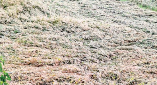
झज्जर। बारिश और तेज हवाओं के कारण गिरी गेहूँ की फसल।