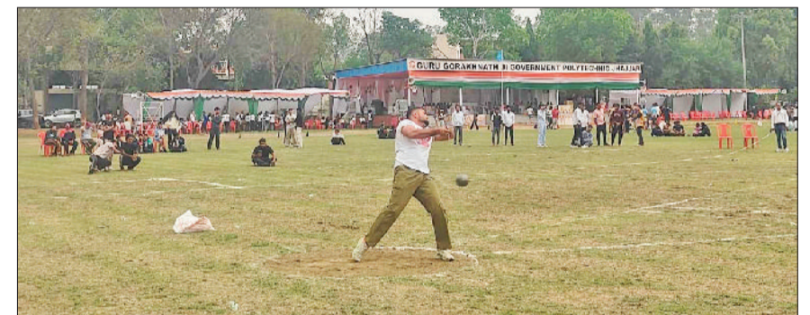
झज्जर। हैमर थ्रो प्रतियोगिता में अपनी प्रतिभा का प्रदर्शन करते हुए खिलाड़ी।