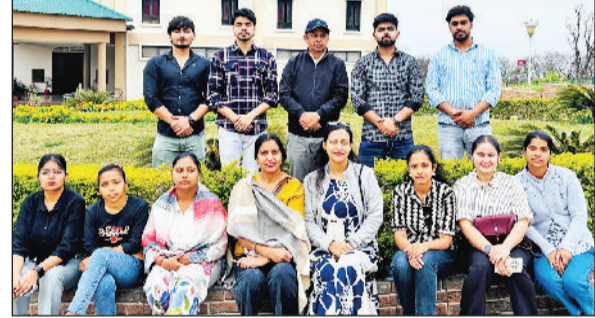
बहादुरगढ़। पालमपुर साइंस सेंटर में बादली कॉलेज के विद्यार्थी।